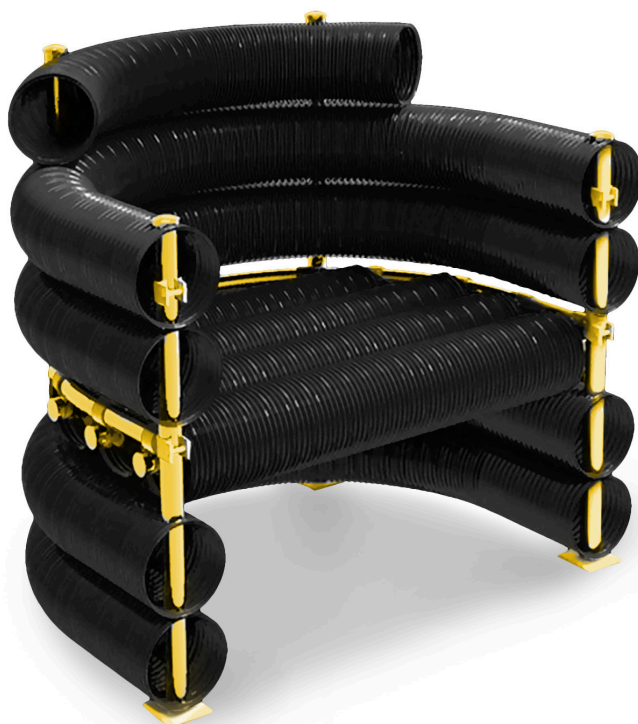
FAUTEUIL NOIR ET DORE / Gold and black armchair

EDITION: ROYAL RIVER.FR © DELATOUR DESIGN PARIS