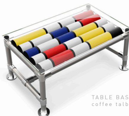
TABLE BASSE / coffee table