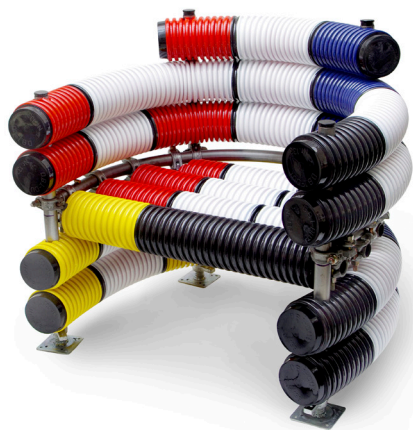
FAUTEUIL / armchair