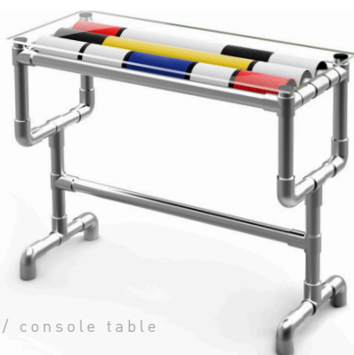
CONSOLE / console table